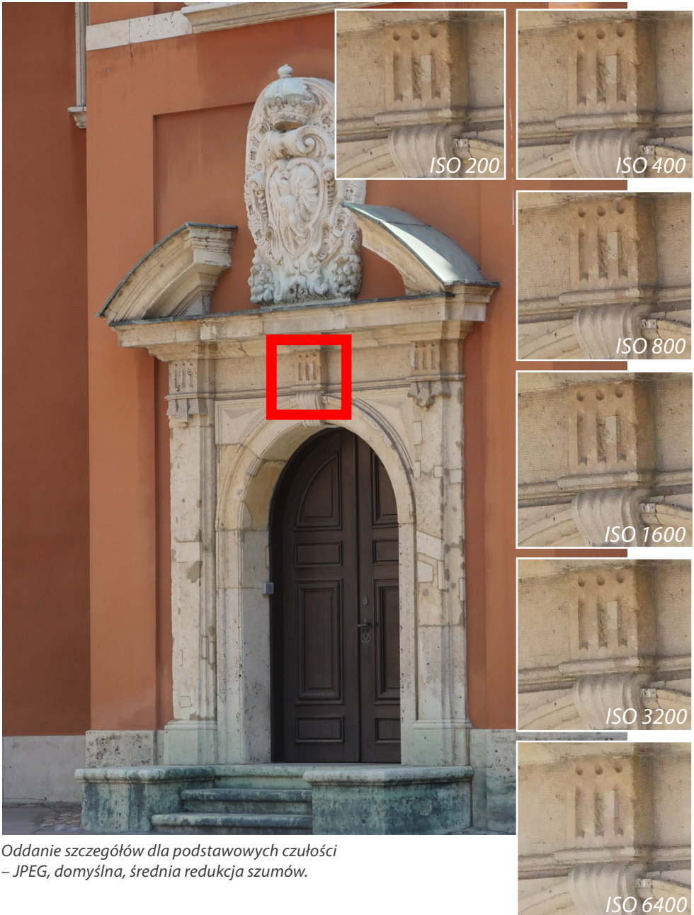
Oddanie szczegółów dla podstawowych czułości – JPEG, domyślna, średnia redukcja szumów.